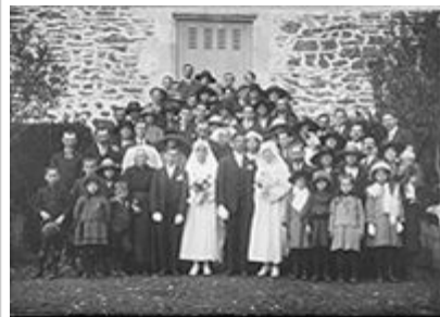
Il n'y a pas si longtemps, la photographie n'était utilisée qu'en de rares occasions comme des mariages. En 2007, 620 milliards de photos seront croquées aux États-Unis seulement. (Photo d'archives)

Daniel Paillé habite Châteauguay. Comme bien des gens aujourd'hui, il trimballe souvent avec lui son appareil numérique. Récemment, il a envoyé quelques photos d'un accident qui venait tout juste de se produire rue Laval à Châteauguay.